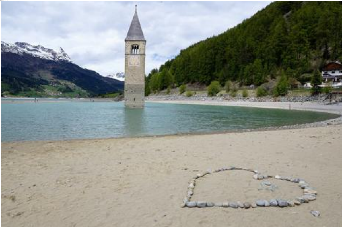
Reschensee, Graun im Vinschgau

„Wir 9 in der Gemeinschaft der Gemeinden Stolberg-Süd“